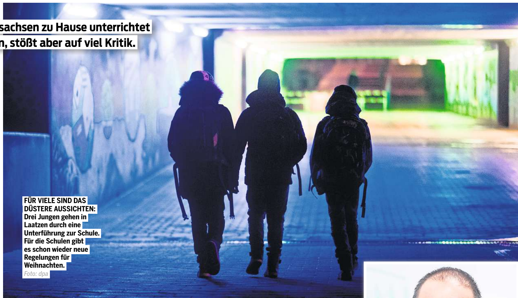
FÜR VIELE SIND DAS DÜSTERE AUSSICHTEN: Drei Jungen gehen in Laaten durch eine Unterführung zur Schule. Für die Schulen gibt es schon wieder neue Regelungen für Weihnachten.

„Schulen sind keine vom Infektionsgeschehen isolierten Inseln, sondern mit der Fülle von Kontaktmöglichkeiten höchst gefährdete Einrichtungen.“ heißt es auch vom Philologenverband Niedersachsen. Deshalb fordert der Landeselternrat andere Infektionsschutzmaßnahmen wie Raumlüfter, Plexiglas und eine Ausstattung mit FFP2-Masken ein. Nach Angaben des Landeselternverbands würde eine Ausstattung mit Raumlüftern und Plexiglas 1,5 Milliarden Euro für sämtliche Klassenräume an deutschen Schulen kosten. „Das ist verhältnismäßig wenig, wenn man bedenkt wie viel Geld in die Wirt-